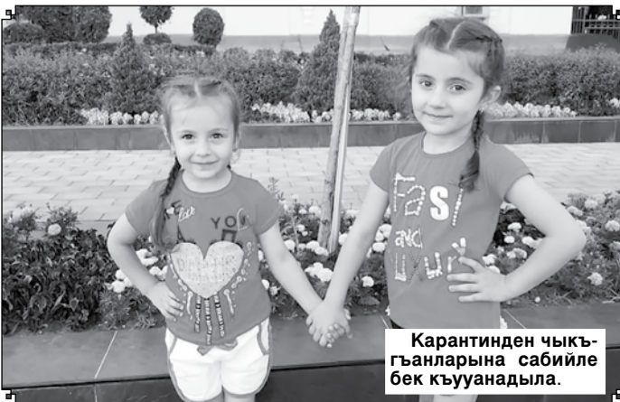
Карантинден чыкъгъанларына сабийле бек къууанадыла.

Жууаланы жарашдыргъанда, аланы ашха жараулу тюрлюлери къайсылары болгъанларыны билирге керекди. Аланы къаууму бек уллуду, алай сууда бир керѳе къайнатып айланмай окъуна аш этип башларгъа жараулу уа жаланда юч тюрлюсю барды: акъ гриб, груздь эмда рыжик.