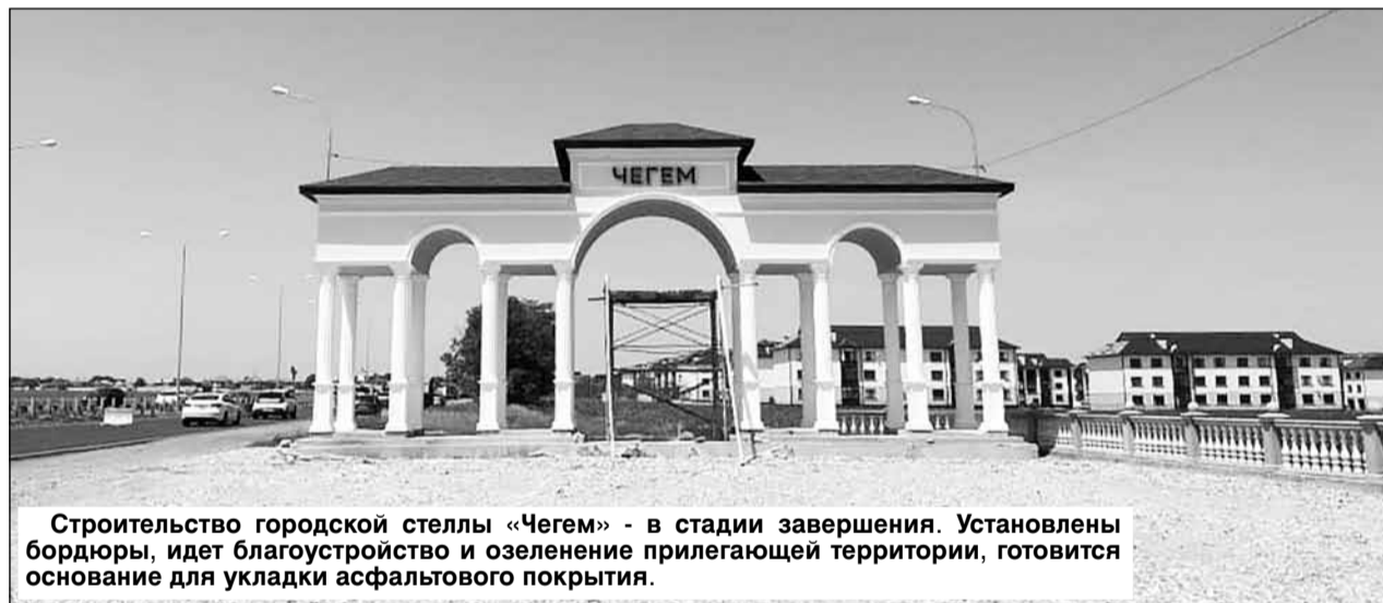
Строительство городской стеллы «Чегем» - в стадии завершения. Установлены бордюры, идет благоустройство и озеленение прилегающей территории, готовится основание для укладки асфальтового покрытия.