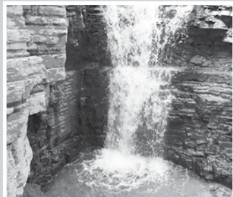
Напэклуэцыр зыгъэхъэзырыр Щоджэн Иннэщ.