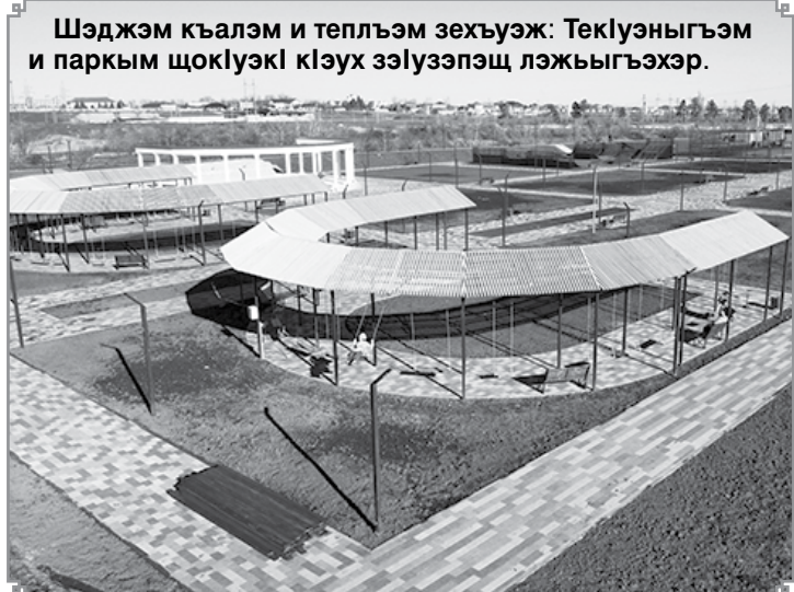
Шэджем къалэм и теплэм зехъуэж: ТекІуэныгъэм и паркым щокІуэкІ кІэух зэлүзэпэщ лэжыгъэхэр.

А жэщ закъуэ губгъуэм сьзэритам сэ сщІат балигъ акъылкІэ сыгупсысэф. ИтІанэ, си адэм и хъуэлсапІэр нэхуапІэ хъун щхъэкІэ, быдэу мурад сщІащ Налшык къа-лэ ськІуэу «Искож» комбинатыр зыхуэу пхъащІэ бригадам сыхыхъэну.