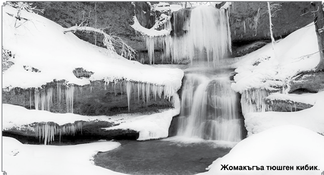
Жомакъгъа тюшген кибик.

Аны жюреклери ауругъанла, дарман иче эселе, ичмей эселе да, ашай турургъа керекдиле. Ол башха дарманла бла бек иги жарашады, тамырда къанны бысымын мардасына келтиредди, холестеринни да. Диабетден къыйналгъанла, артыкъда экинчи тюрлюсюнден ауругъанла, бу битимни ашасала бек иги боллукъду. Андан сора да, ол къанда бал тузну азайтады, гликолиз деген затны къуралууна чирмауукъ этеди. Къанда балтуз кеп болса уа, гликолизле мардадан кеп боладыла эм адамны терк къартайтадыла. Ма былайда керекди сарымсахны жаш этген кючу. Къысхасы, кеп къыралада алимле сарымсахны кючюн тинтиуню бюгюн да бардыргъанлай турадыла.