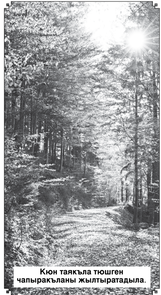
Кюн таякъла тыюшген чапыракъланы жылтыратадыла.

Былайда Евгений Касперскийни - «Касперский лабораториясыны» генеральный директорун да унутуп иймейик. Аны журналистле бла ушагъында: «Мени компаниям, Москвада фатарым бла BMW машинам бардыла. Аладан сора жугъум жокъду», - дегени жамауатда терк жайылгъан эди. Касперский тау лыжаланы бек сюеди, баям, анга кѳп ахчаны да жоады. Жюрютген а учуз сагъатланы бла белгисиз маркалы кийимлени этеди.