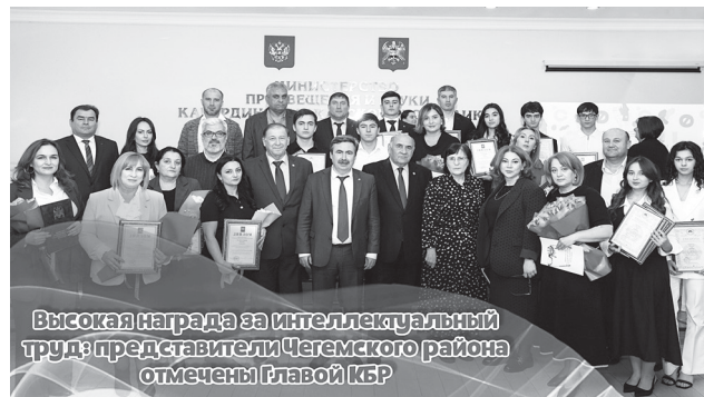
Высокая награда за интеллектуальный труд: представители Чегемского района отмечены Главой КБР

В числе награждённых - ученицы и педагоги из Чегемского муниципального района. Победителями