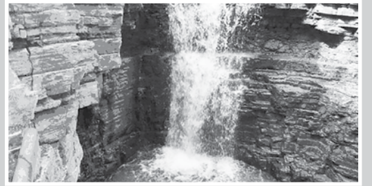
Бетни хазырлагъанды Будаиланы Мадина.