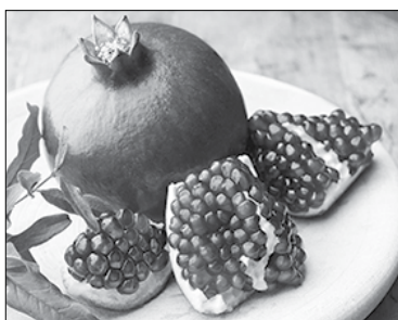
хуэдизи мэхъу, ауэ плыжыщ.

Балигъхэм я процент 99-м авто-мобиль, мотоцикл зэрагъэклэуэ хуитыныгъэ ялэщ. Абы и щхъэу-сыгъуэр жылагъуэ транспортым флыуэ зэрызымыужъарщ, абы къыхэккыуэ псоми ялэжщ езыхэр зэрызекълун.