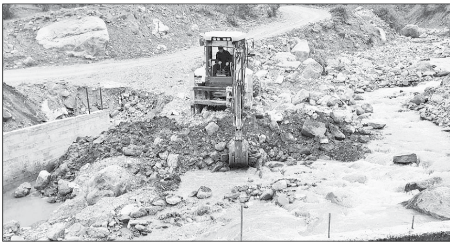
Ведутся работы по берегоукреплению перехода через реку Кардан и ремонт подъезда от автодороги Чегем II - Булунгу до урочищ «Думала», «Мамаш-Бау», «Лекуто».