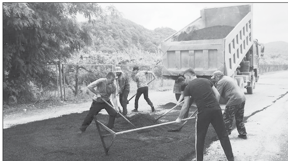
В целях благоустройства с.п.п. Звездный за счет средств бюджета населенного пункта в настоящее время проводится ямочный ремонт дорог.