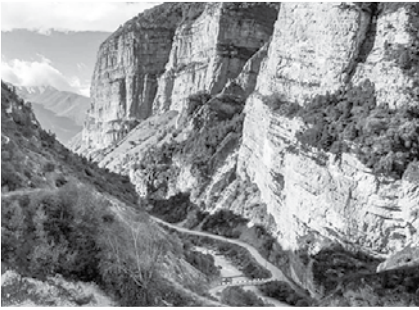
Напкүлүцүр зыгъэхъзырыр Щоджэн Иннэц.