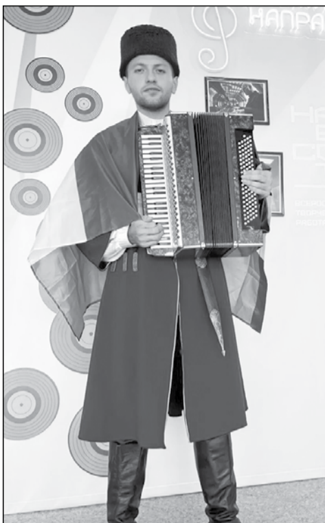
Клава Кока, Jony, Леонид Агутин и группа Любе», - делится впечатлениями молодой музыкант.